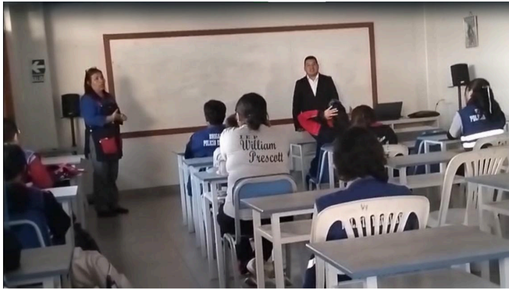
Figura 02: Aplicación de encuesta