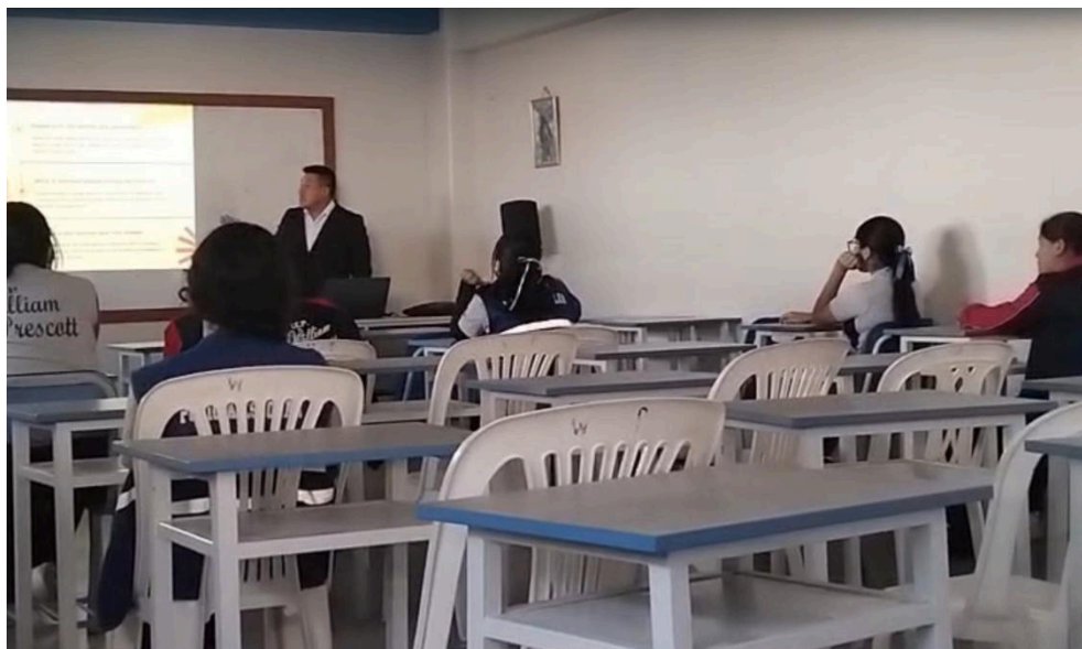
Figura 03: Aplicación de encuesta