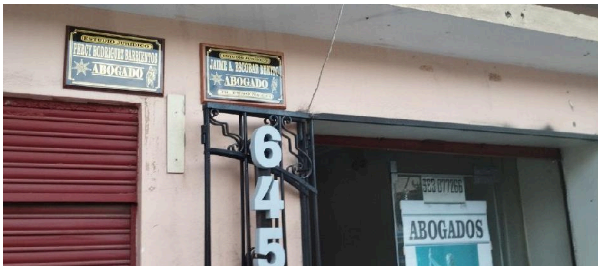
Figura 06: Sexta evidencia de información