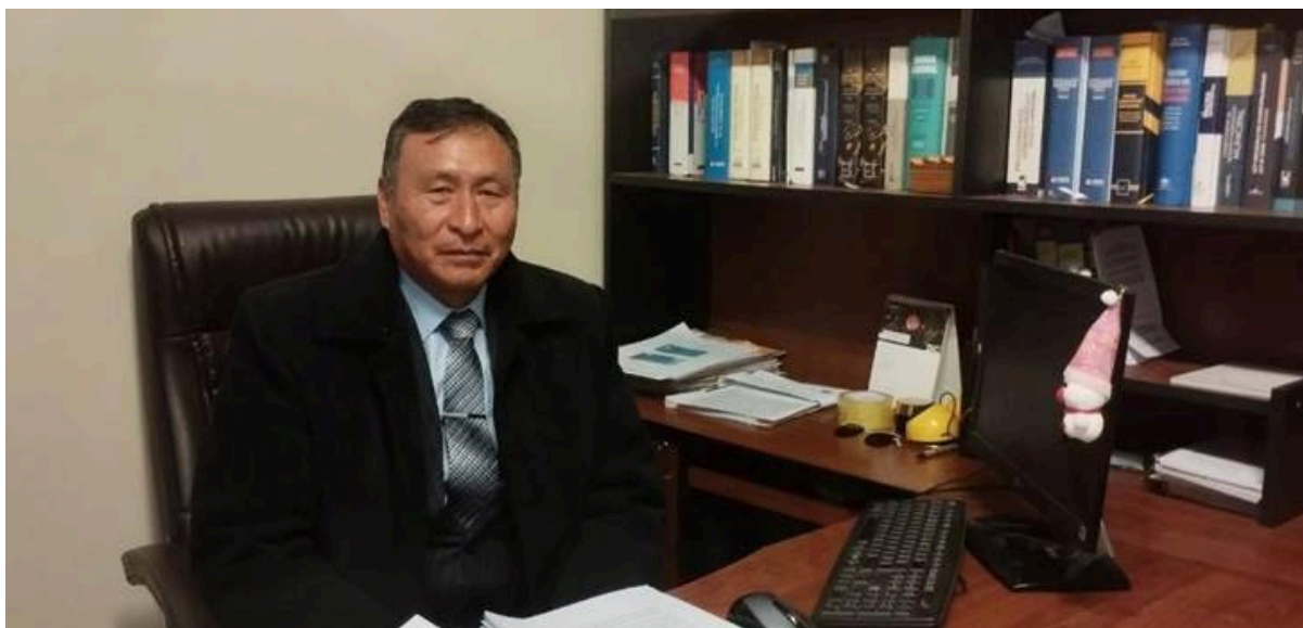
Figura 05: Quinto entrevistado