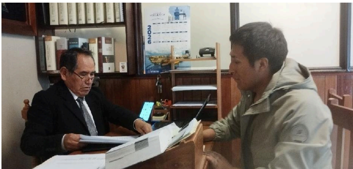
Figura 04: Cuarto entrevistado