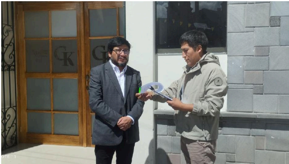
Figura 03: Tercer entrevistado