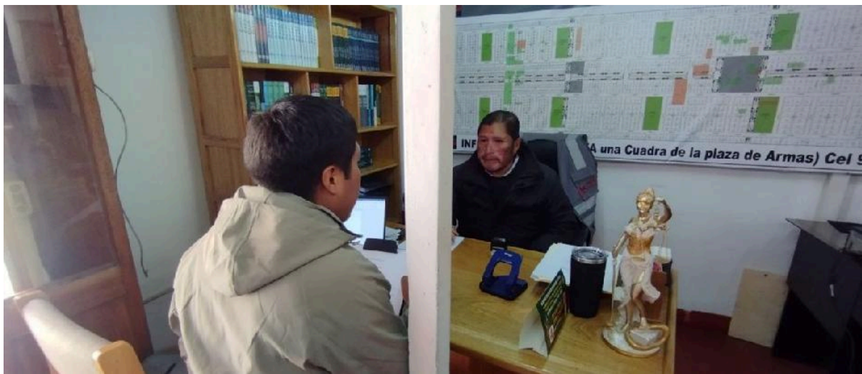
Figura 01: Primer entrevistado