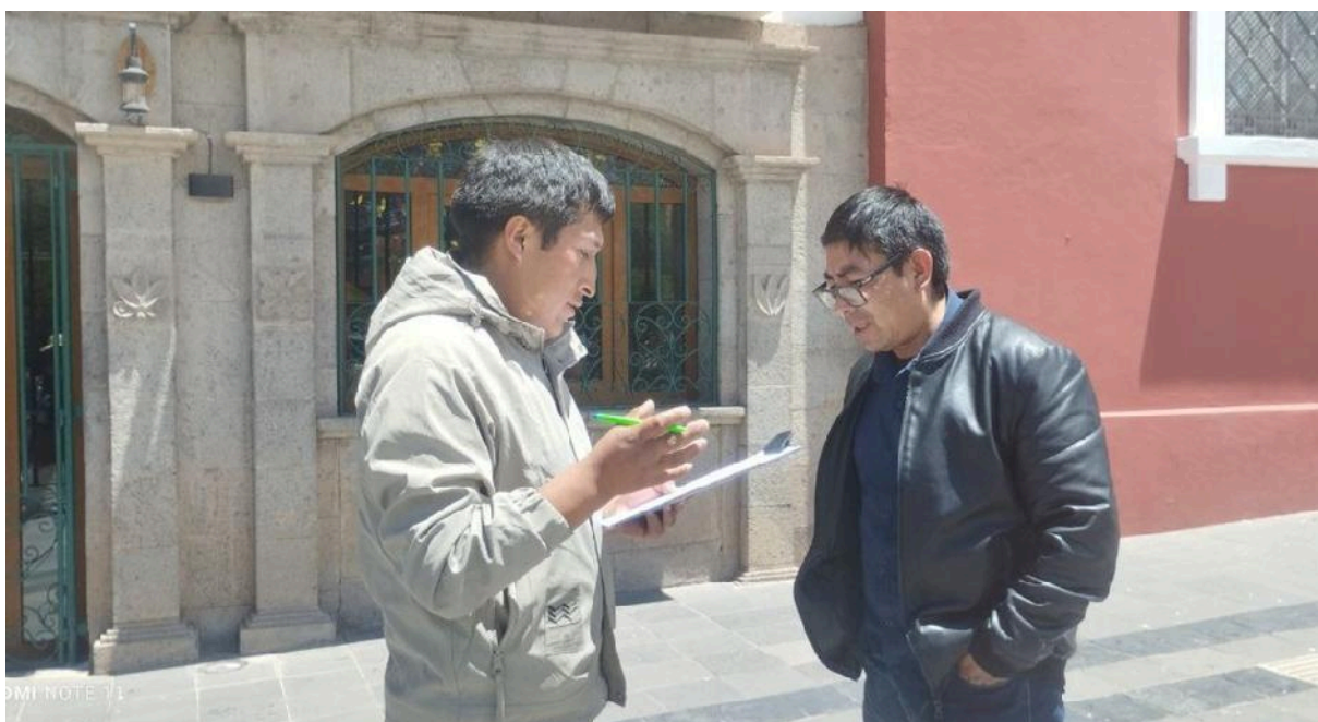
Figura 02: Segundo entrevistado