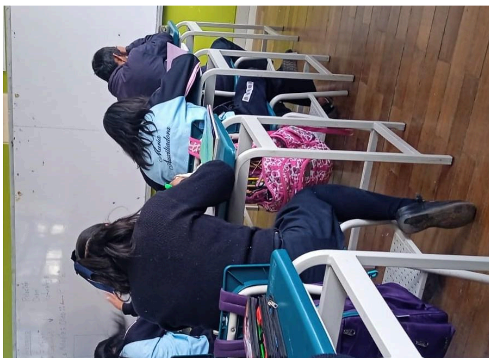
Figura 03: Estudiantes de la I.E.S. Maria Auxiliadora completando los cuestionarios.