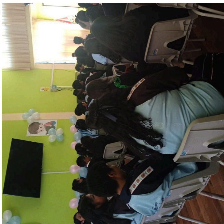
Figura 02: Estudiantes de la I.E.S. Maria Auxiliadora que cumplieron con los criterios de inclusión y están recibiendo la explicación para completar los cuestionarios.