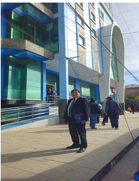
Figura 02: Frontis de la Municipalidad