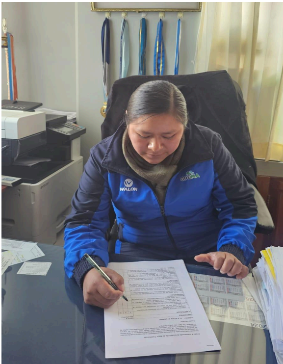
Figura 03: Llenado del cuestionario de parte de una trabajadora de la Municipalidad