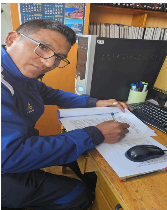
Figura 01: Llenado del cuestionario de parte del trabajador de la Municipalidad