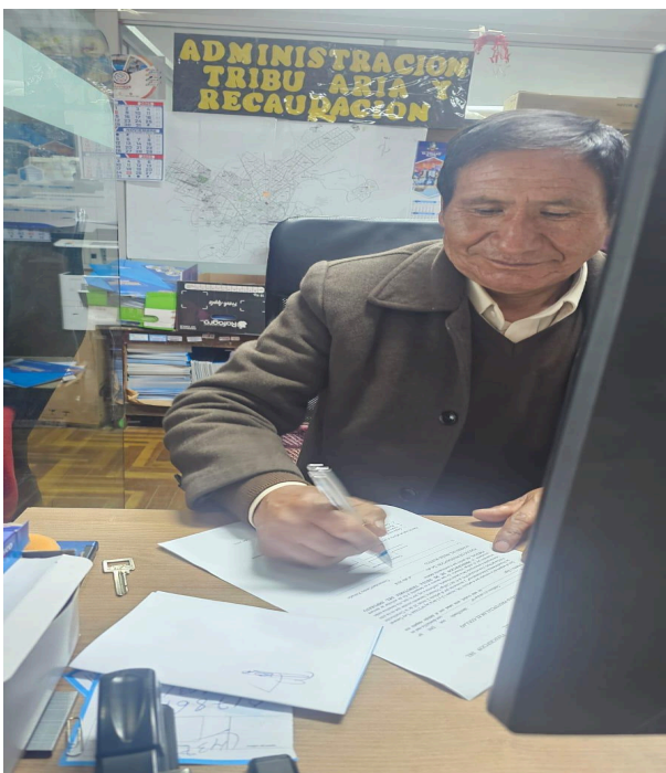
Figura 04: Aplicación del cuestionario