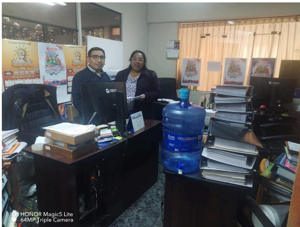
Figura 02: Control patrimonial