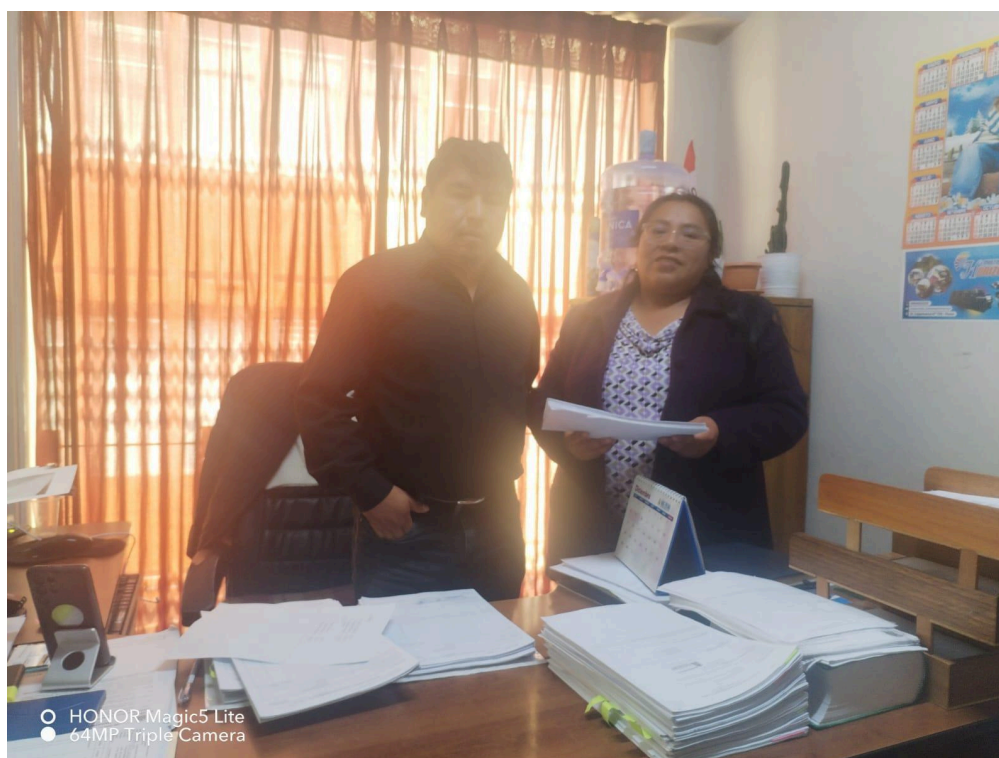
Figura 03: Adquisiciones