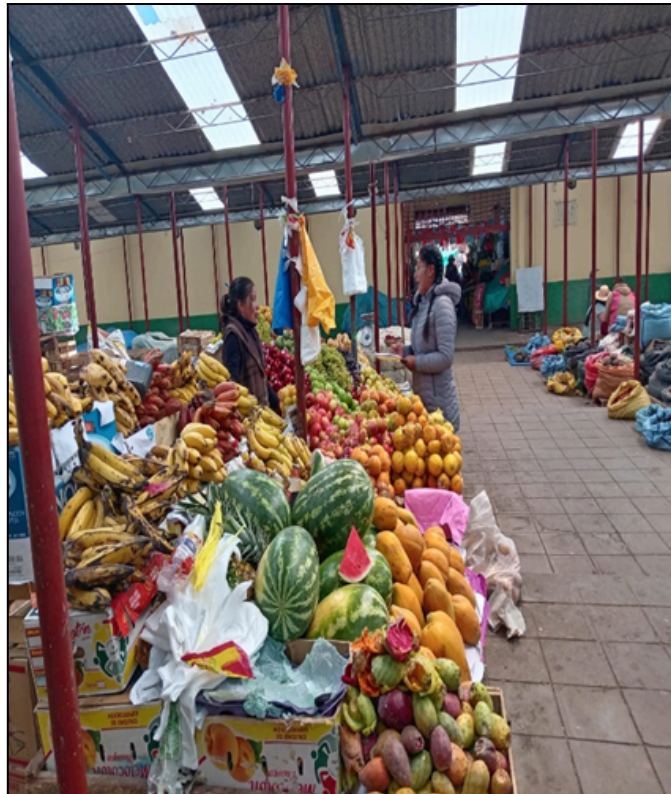
Figura 03: Encuestando comerciante de venta de frutas