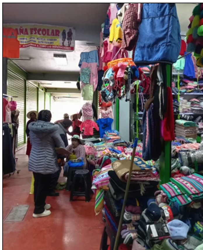
Figura 04: Encuestando comerciante de venta de ropa