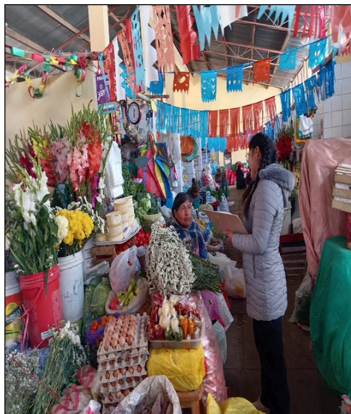
Figura 02: Encuestando comerciante de venta de flores