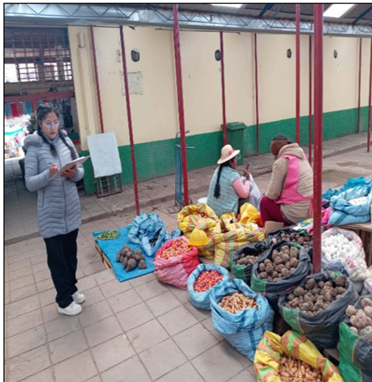
Figura 01: Encuestando comerciante de venta de papas