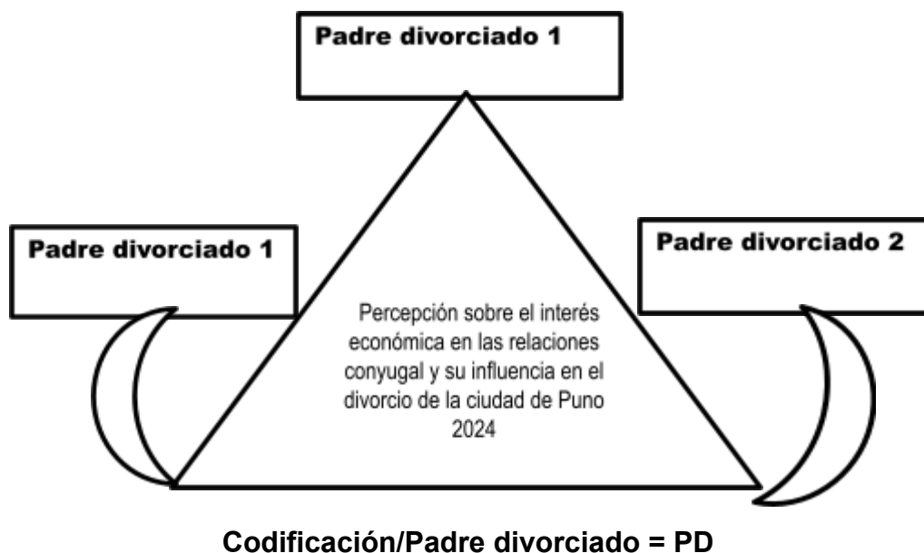
Figura 01: Triangulación de las entrevistas

La información se obtuvo de los tres padres divorciados que participaron en los procesos de separación conyugal, la cual se efectuó mediante la triangulación de las entrevistas y la codificación de uno de los elementos de estudio que facilitará el análisis e interpretación de los contenidos texto de las entrevistas.