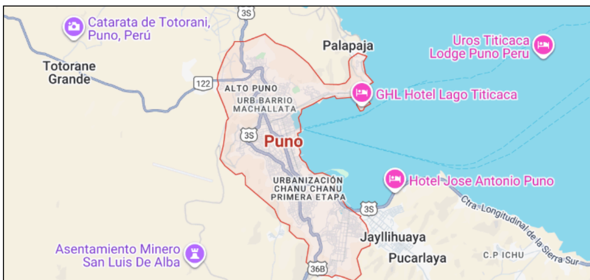
Figura 01: Ubicación geográfica de la ciudad de Puno, región Puno, Perú.

El estudio se llevó a cabo en la ciudad de Puno, un espacio urbano donde se concentraban diversas agencias de crédito. Esta ciudad estaba ubicada en la ribera del lago Titicaca, en su bahía interior, y su población se dedicaba principalmente al comercio, tanto formal como informal. Además, el turismo constituyó una de las principales actividades económicas de la región.