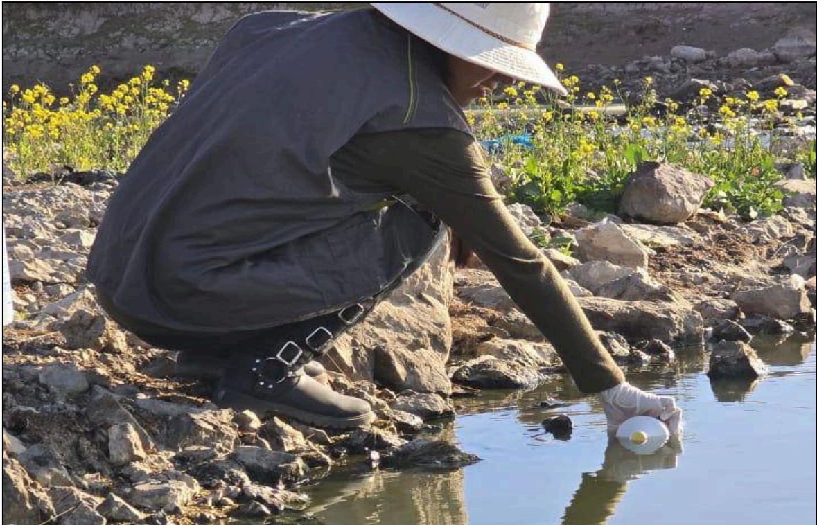
Figura 05: Toma de muestras de aguas superficiales en el río Coata (CoatM2)