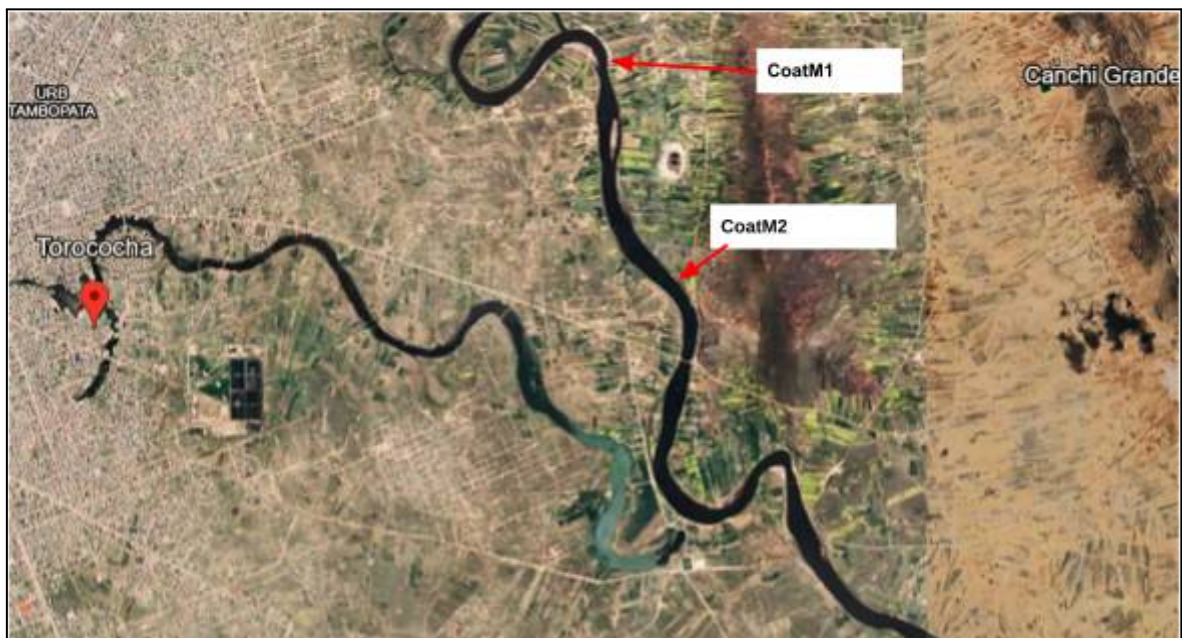
Figura 02: Imagen satelital de río Coata