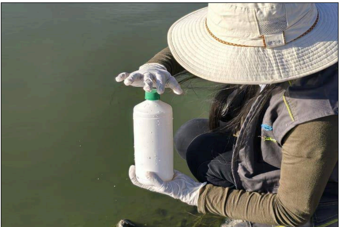
Figura 04: Toma de muestras de aguas superficiales en el río Coata (CoatM1)