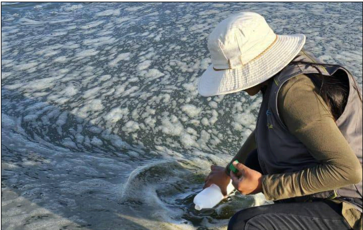
Figura 06: Toma de muestras de aguas superficiales en el río Coata (CoatM2)