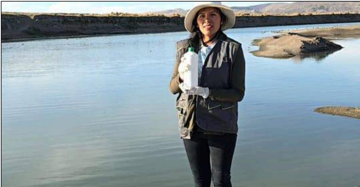
Figura 03: Toma de muestras de aguas superficiales en el río Coata (CoatM1)