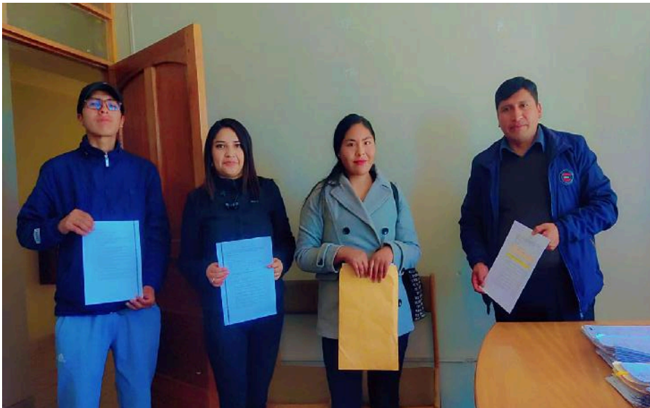
Figura 02: Funcionarios del distrito de acora