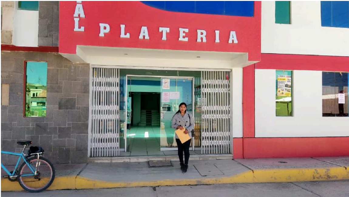
Figura 03: Municipalidad Distrital de Plateria