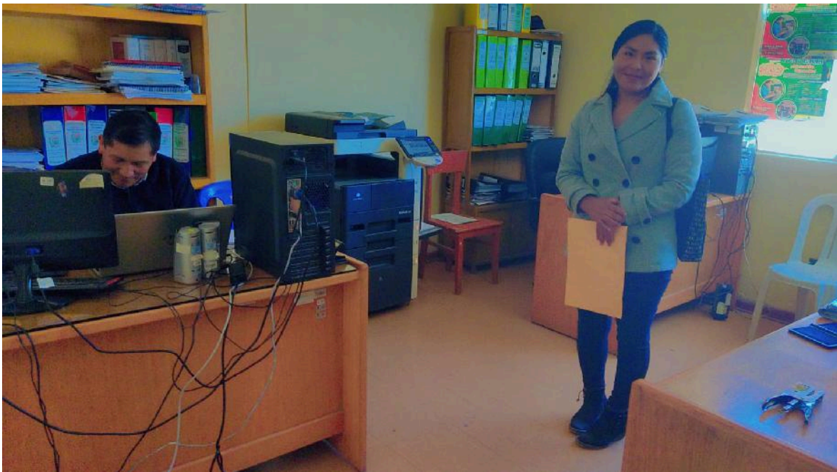
Figura 04: Funcionario de la oficina presupuesto de la Municipalidad Distrital de Platería