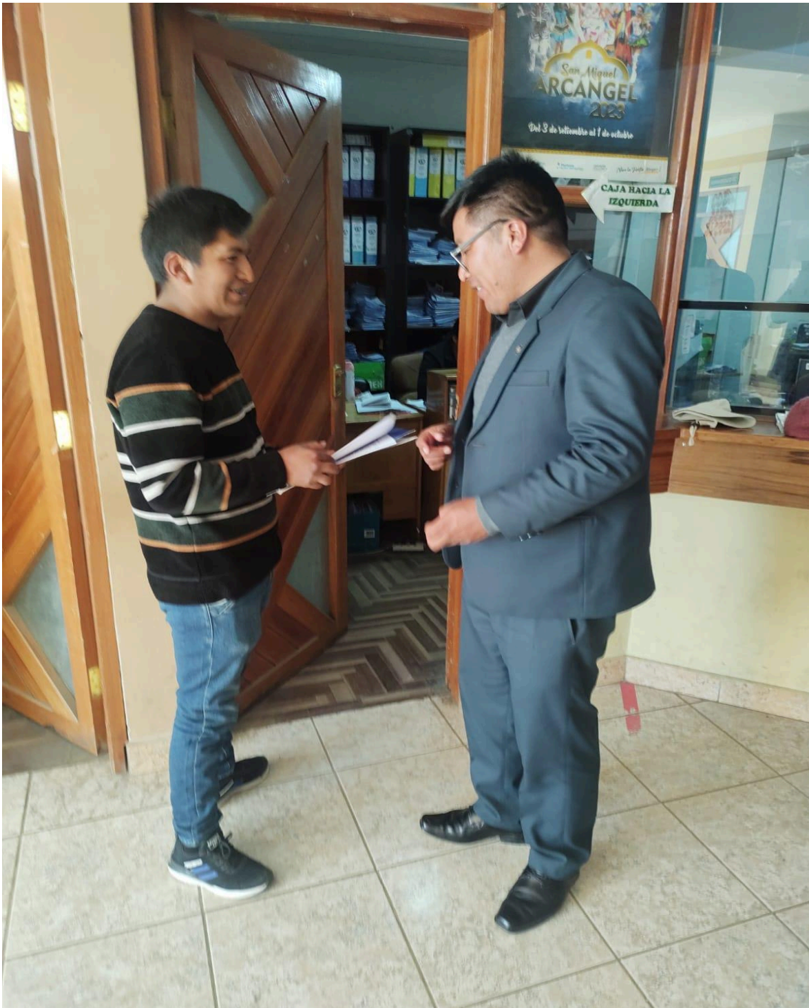
Figura 04: Coordinación con el jefe de la oficina de ejecución coactiva.