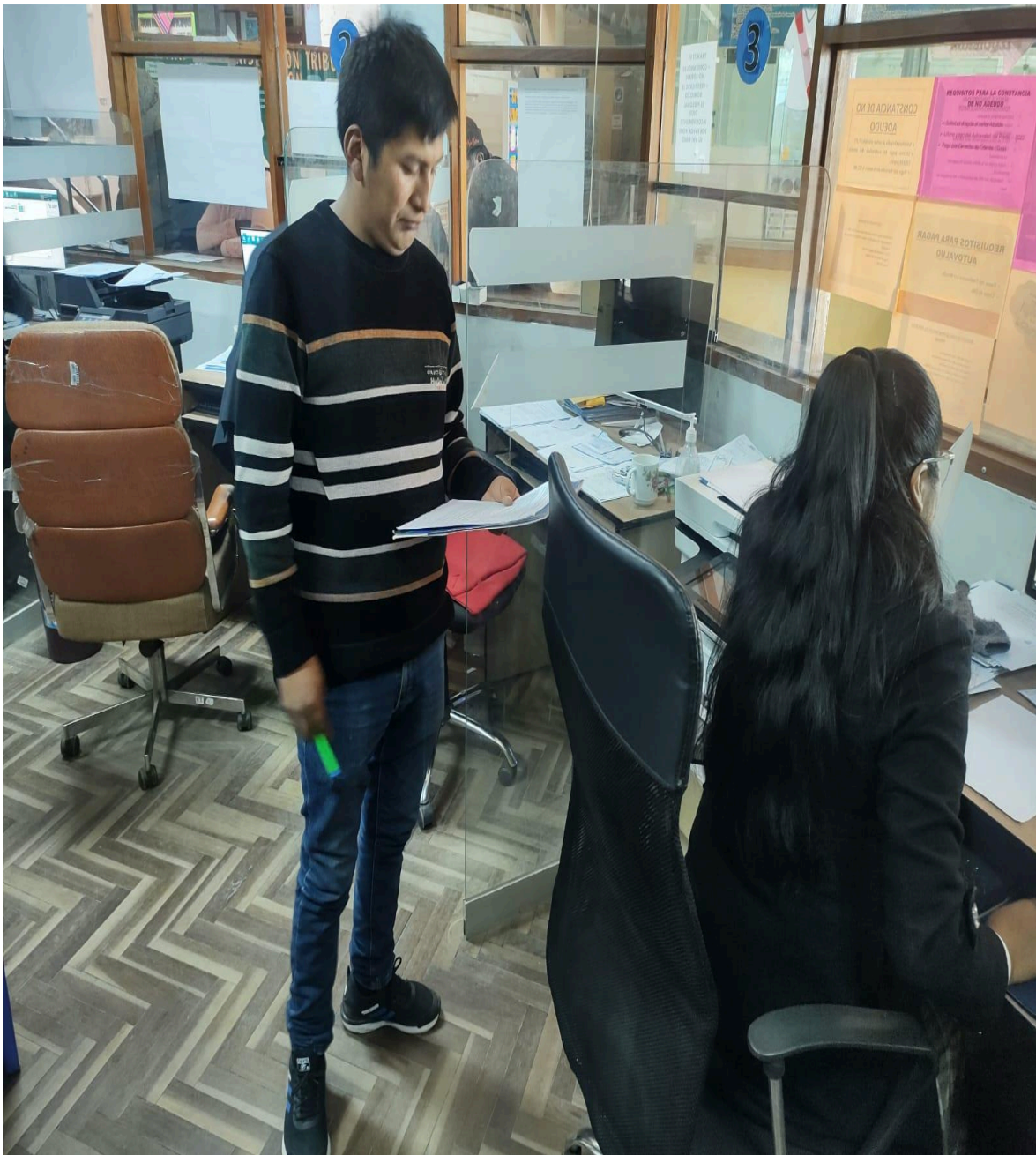
Figura 05: Encuesta al personal del municipio.