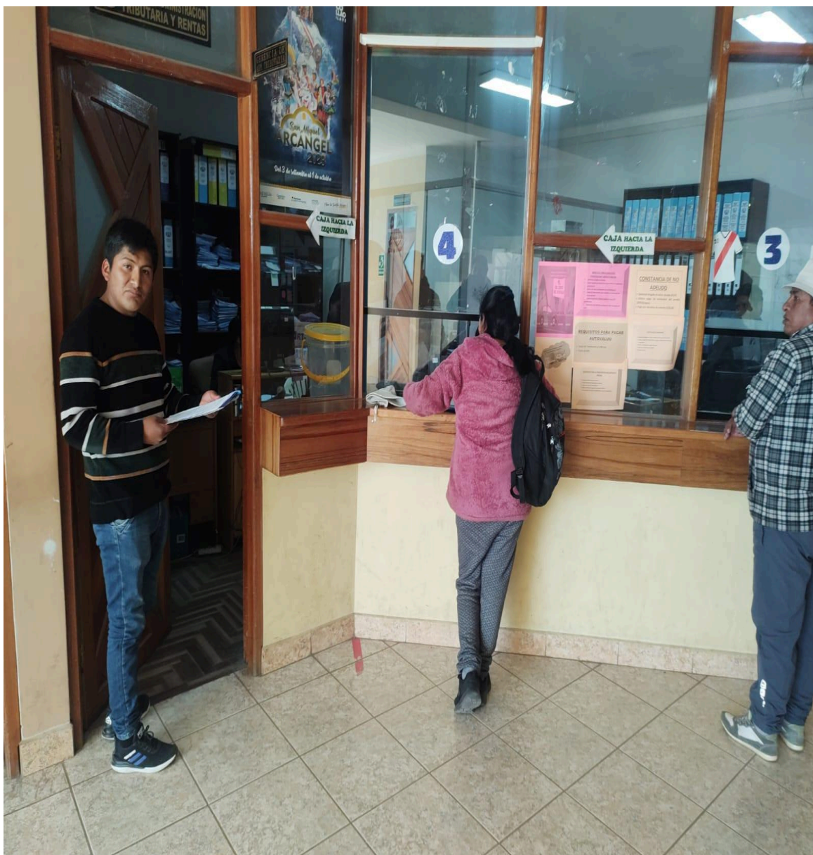
Figura 03: Preparados para realizar la encuesta al personal de la municipalidad.