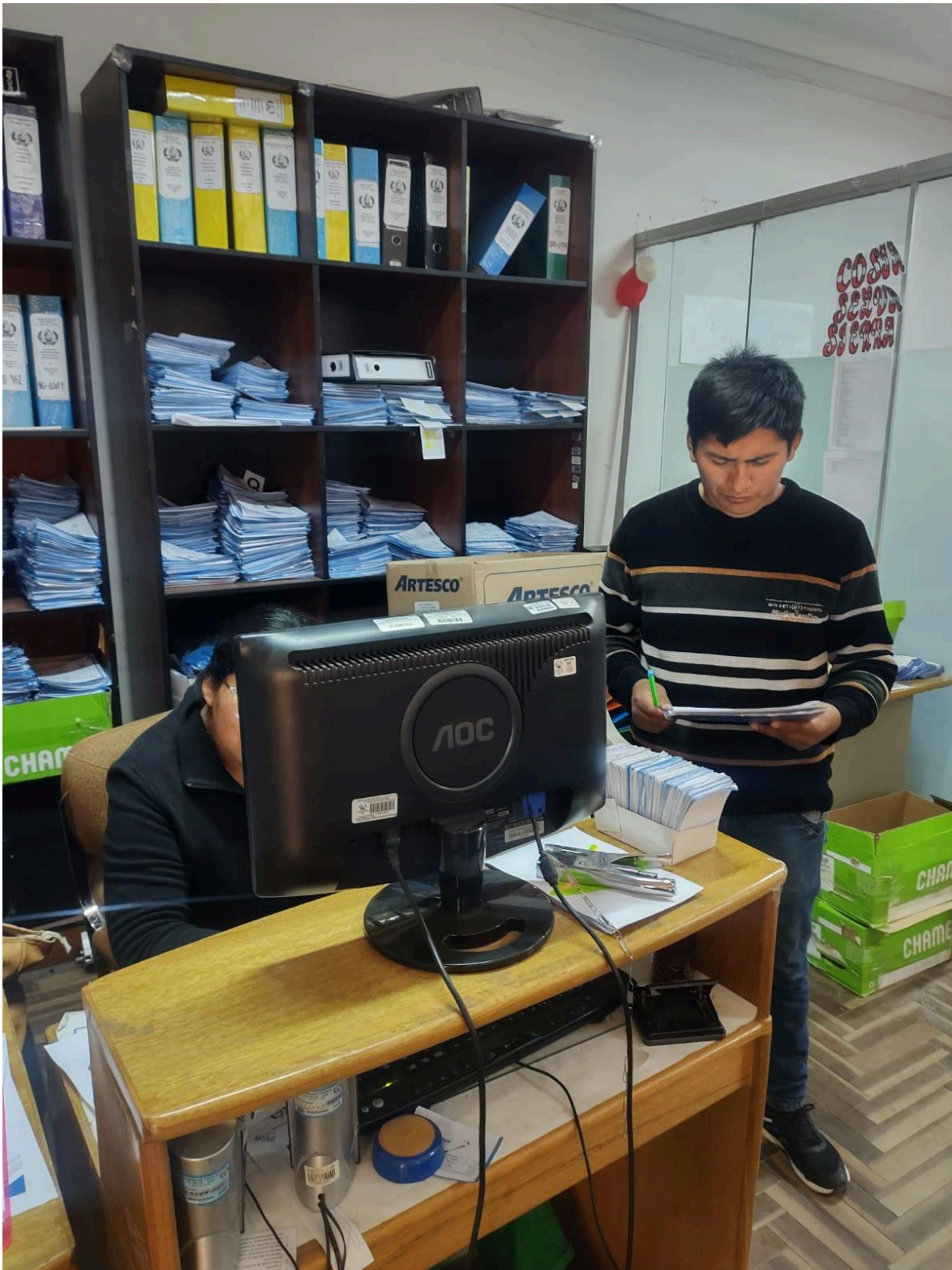
Figura 06: Encuesta al personal encargado de fiscalización del municipio.