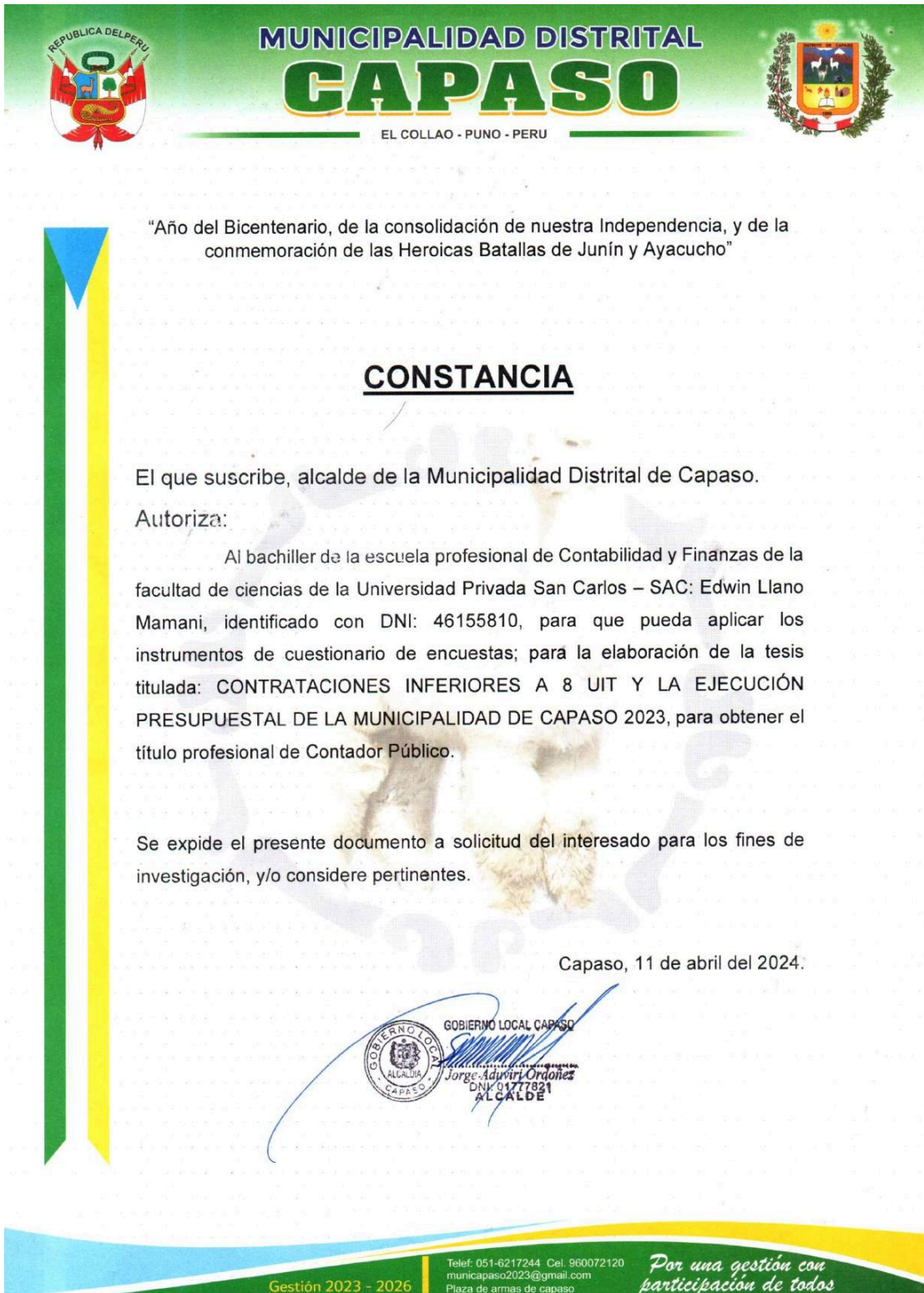
Imagen 03: Carta de autorización para realizar la encuesta.