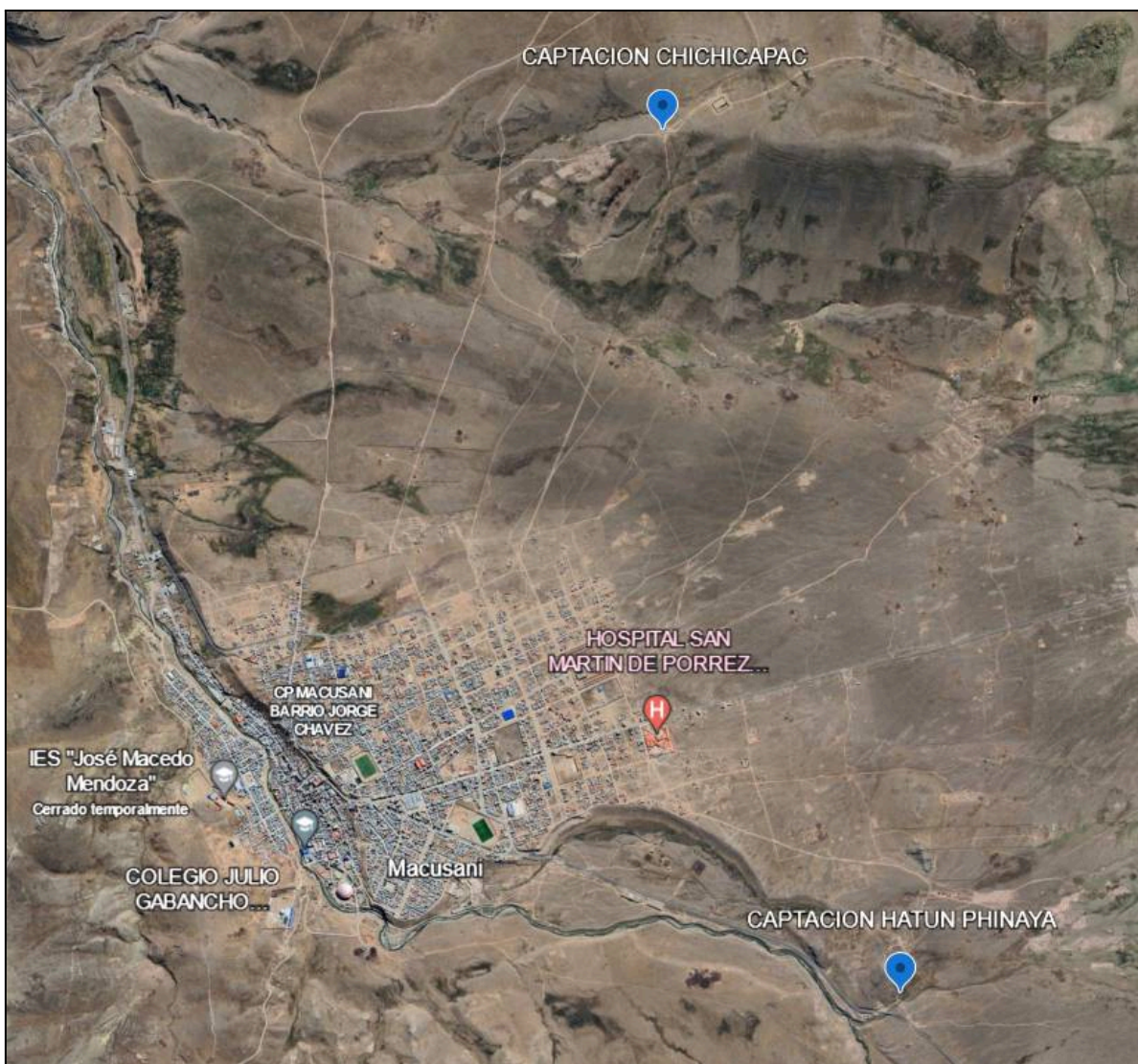
Figura 01: Ubicación de la zona de Estudio.