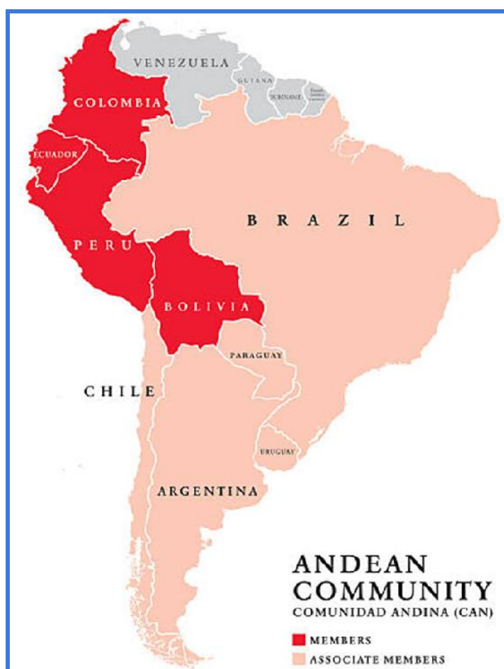
Figura 01. Países de Comunidad Andina o Pacto Andino.

como un organismo internacional líder en integración en el continente, con la intención de mejorar la calidad de vida de 111 millones de ciudadanos andinos, cuyo objetivo es alcanzar un desarrollo integral, equilibrado y autónomo, mediante la integración andina, con proyección hacia una integración sudamericana y latinoamericana. Los beneficios en términos comerciales se dan bajo el marco de la CAN, donde se establecieron ámbitos de acción con el fin de facilitar el comercio entre los países participantes, la primera de ellas está destinada a el acceso a mercados por lo cual se puede encontrar en ella los gravámenes, restricciones, normas de origen, facilitación de comercio y aduanas y competencia y defensa comercial, seguida por la sanidad agropecuaria refiriéndose a la animal, vegetal junto con la inocuidad alimentaria y por último la calidad (Comunidad Andina, 2018).