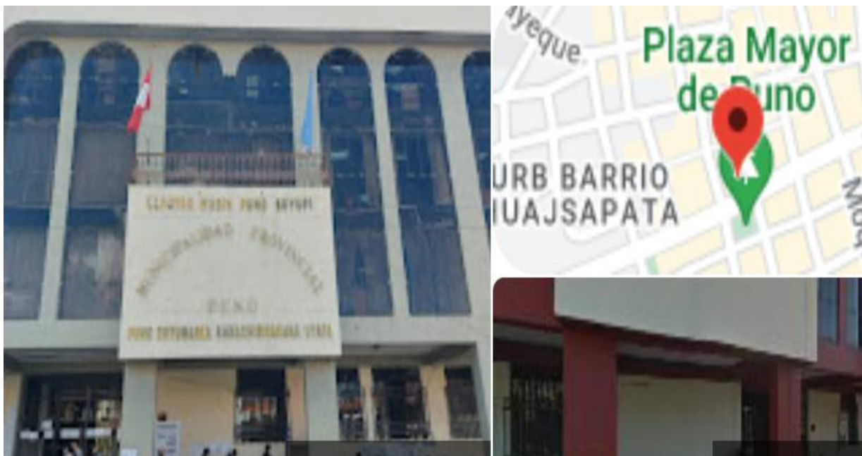
Figura 1: Ubicación de la Municipalidad Provincial de Puno

La investigación se desarrolló en la Municipalidad provincial de Puno, donde se evaluó los expedientes técnicos y cómo han influido para una buena ejecución de liquidación de obras por administración directa.